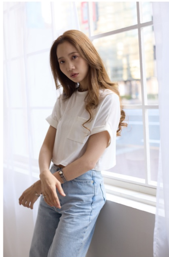
1/160s f3.5 ISO400