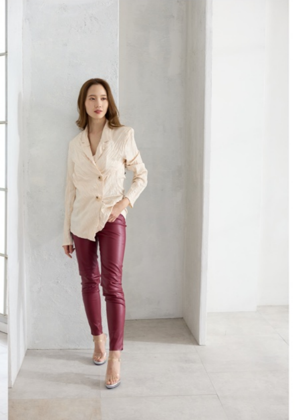
1/100s f3.5 ISO800