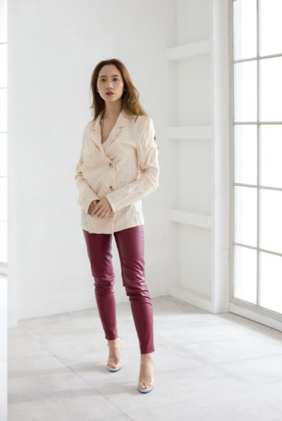
1/100s f3.5 ISO800