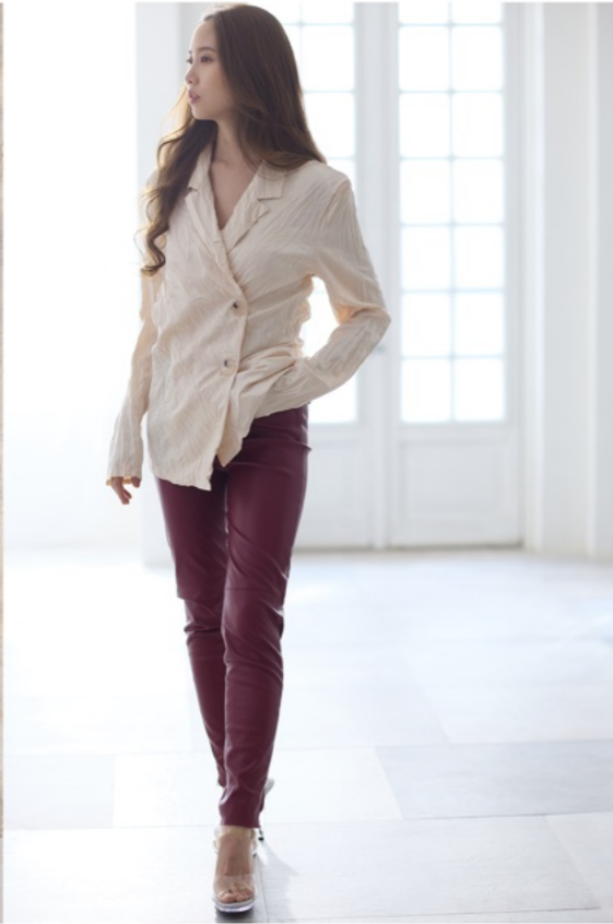
1/100s f2.2 ISO640