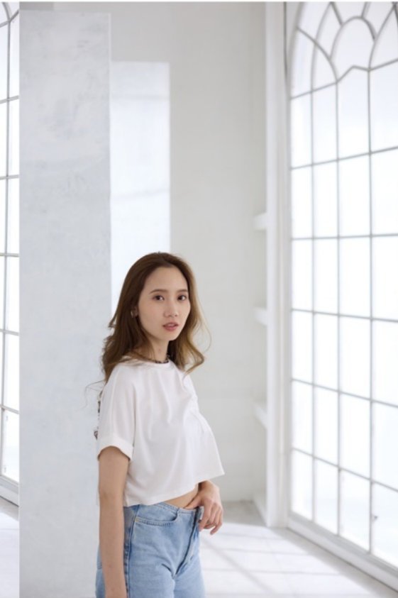
1/100s f3.2 ISO320