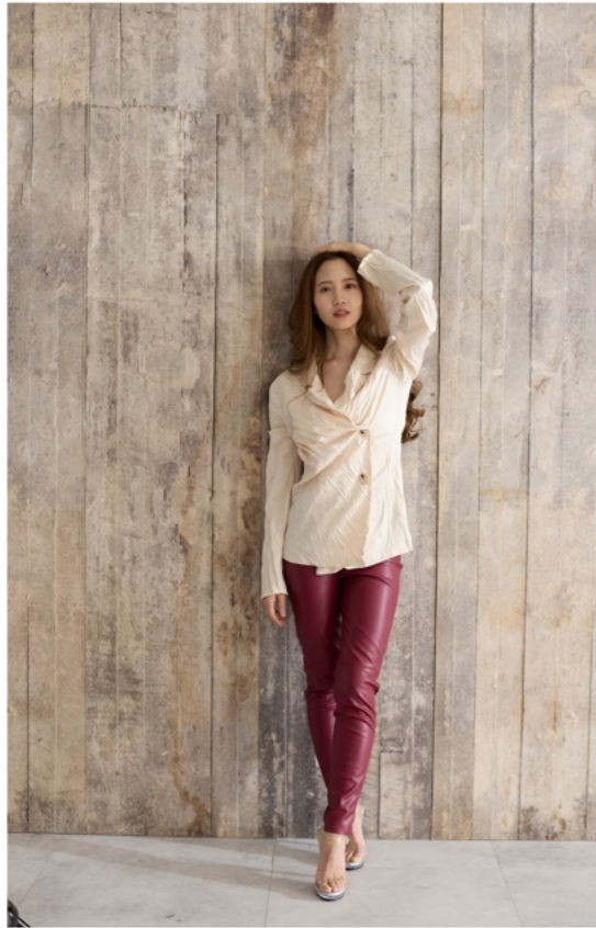
1/100s f3.2 ISO1000