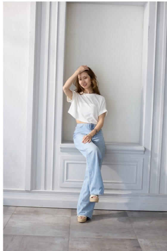
1/100s f2.8 ISO800