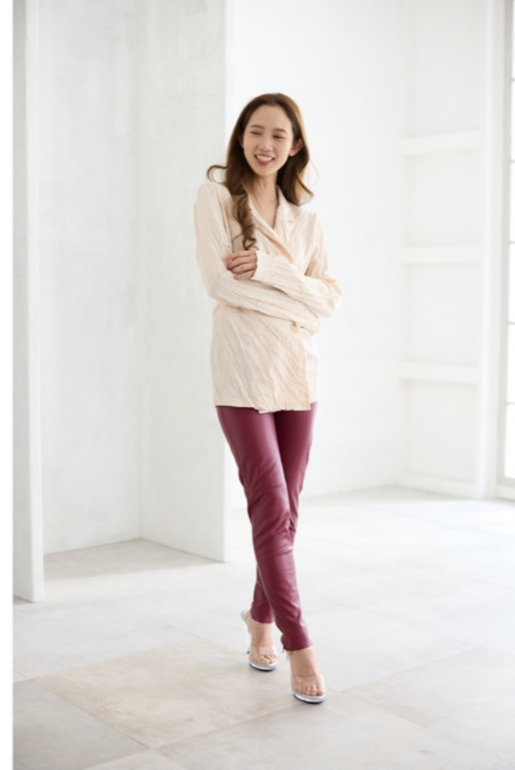
1/80s f2.5 ISO800