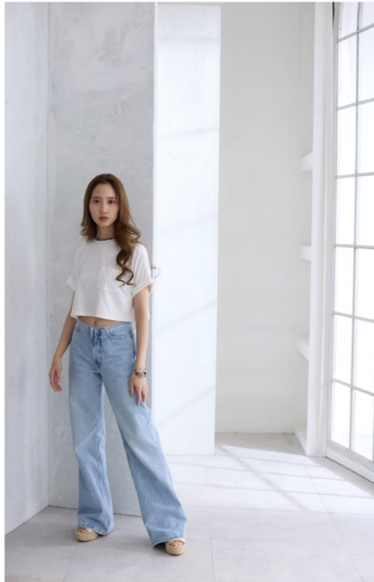
1/100s f3.2 ISO320